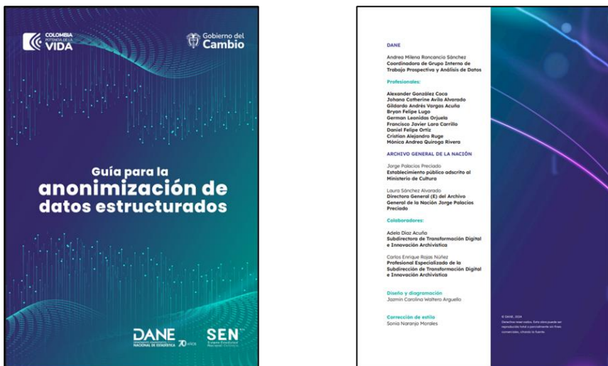
Figura 3. Guía para la Anonimización de datos estructurados

La Guía para la anonimización de datos estructurados, se centra en orientar a los integrantes del SEN sobre el proceso de anonimización de bases de datos que provienen de registros administrativos, operaciones estadísticas y fuentes secundarias.