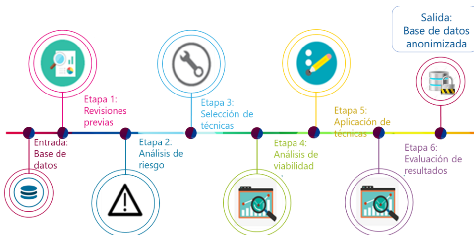
Figura 4. Proceso de anonimización