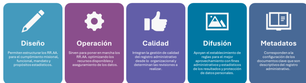
Figura 1. Buenas prácticas para la configuración de registros administrativos

En el documento de lineamientos se identifican cinco grupos de buenas prácticas que permiten identificar fortalezas y oportunidades de mejora al momento de realizar una revisión al proceso de un registro administrativo.